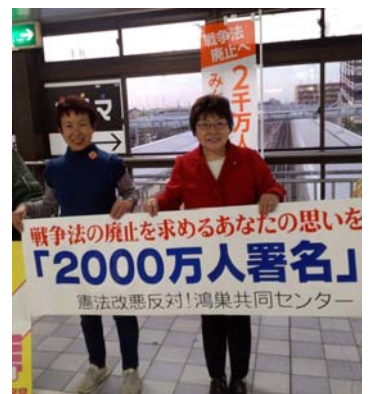
鴻巣駅自由通路で署名活動