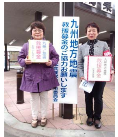
鴻巣駅西口で 救援募金活動