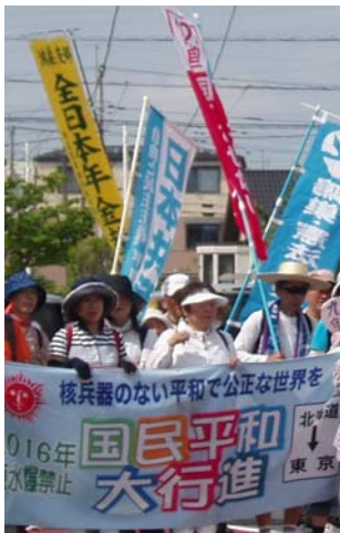
平和行進に参加しました。 鴻巣市役所→北本市役所まで 歩き、戦争法廃止・核兵器 NO の声をあげました。

給付をカットする年金の改悪、ギャンブル依存症を増やすカジノ法、日本の経済主権を多国籍企業に売りわたすTPP — 国民の大多数が反対した3悪法を安倍政権はゴリ押しをしました。