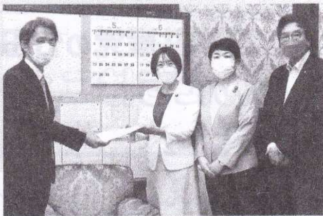
日本共産党国会議員団は「消費税減税・インボイス中止法案」を参議院に提出。すべての品目で値下げができる消費税減税を強く政府にもとめました=5月30日、国会内