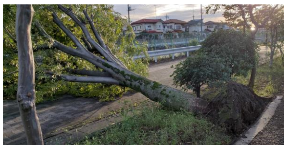
マミーマート生出塚店前から市役所に向かう 一方通行道路上に根元から倒れた樫

台風24号日本列島を縦断 被災された皆様に心よりお見舞い申し上げるとともに、犠牲になられた方々に深い哀悼の意を表します。